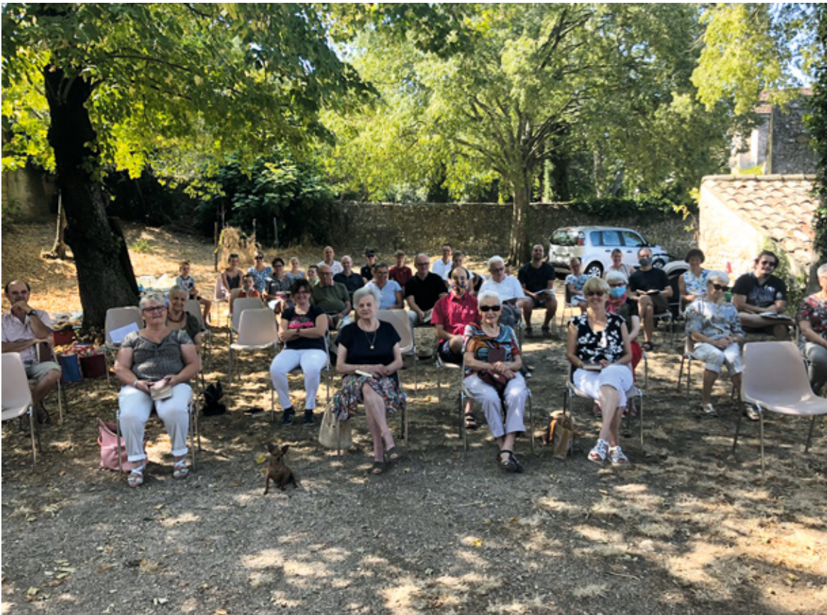
Een bezoek aan een buitenlandse kerkdienst is de moeite waard. Het biedt ons de kans om te zien wat God op andere plaatsen doet en je kunt een zegen voor anderen zijn. Foto: open-luchtdienst in Brouzet-les-Alès, Frankrijk.