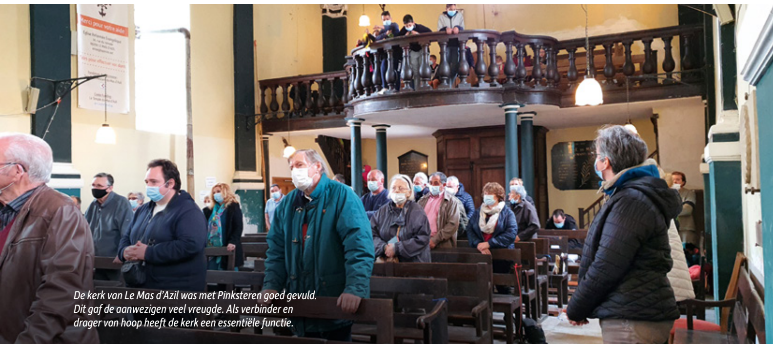
De kerk van Le Mas d'Azil was met Pinksteren goed gevuld. Dit gaf de aanwezigen veel vreugde. Als verbinder en drager van hoop heeft de kerk een essentiële functie.

Zo kijkt een van mijn burens vanuit nieuwsgierigheid van tijd tot tijd online mee en regelmatig leidt dat tot boeiende, inhoudelijke geloofsgesprekken. Recent liet ze me weten dat ze heel graag naar een 'echte' dienst mee zou willen gaan. Zo kunnen digitale diensten de fysieke kerkdiensten niet vervangen, maar mensen wel nieuwsgierig maken om meer te ontdekken over God en geloven. Binnen het regionale jeugdwerk hebben we dankbaar gebruik gemaakt van de online mogelijkheden om verbonden te kunnen blijven met elkaar. Recent hielden we een drietal online bijeenkomsten voor de jeugd van Zuidwest-Frankrijk. Maar liefst veertig schermen waren verbonden en brachten zo de gemeentes Toulouse, Montauban, Agen, Saint-Girons, Clairac en Rodez met elkaar in contact. Iedere keer deden er rond de vijftig deelnemers mee. Ondanks beeldscherm afstand kunnen online samenkomsten toch verbindend werken. Deze digitale jongerengeneratie is het meer dan waard om in te investeren. We zien dan ook met verlangen uit naar de jongerenweekenden in september om deze jongeren weer face-to-face te ontmoeten, hen weer in de ogen te kunnen kijken en persoonlijk te spreken. Tot die tijd houden we elkaar online vast.